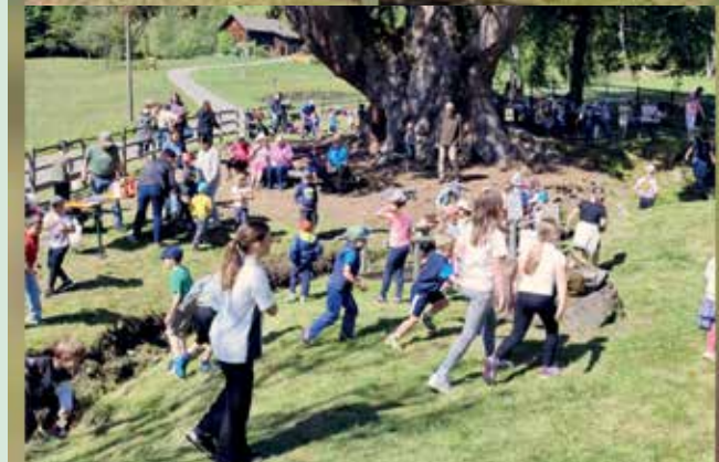
„Kneippgeburtstag“ bei der Kandelaberfichte