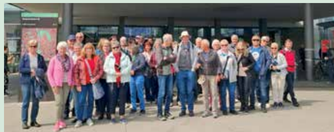
Ausflug nach Graz

Unsere aktuellen Termine und die genaue Info bekommt man auch über WhatsApp. Wer noch nicht dabei ist, kann sich einfach unter 0677/61400200 melden.