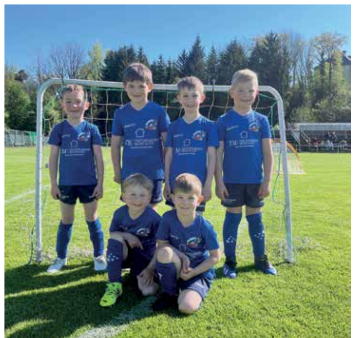
Die U7 präsentiert stolz die neuen Dressen am Fußballplatz