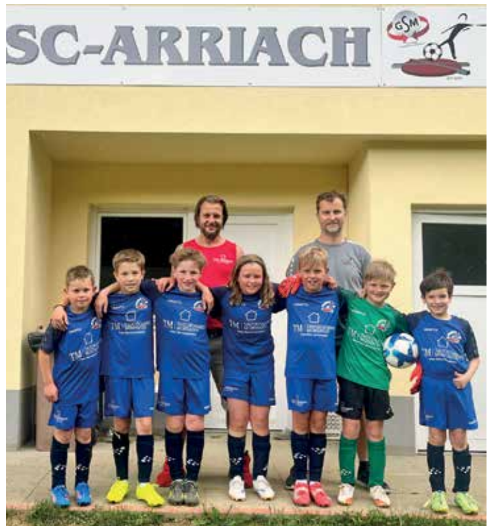
Die U9 mit den neuen Dressen vor dem Vereinsgebäude.

„Vielen Dank für die großartige Unterstützung!“