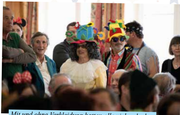
Mit und ohne Verkleidung hatten alle viel zu lachen