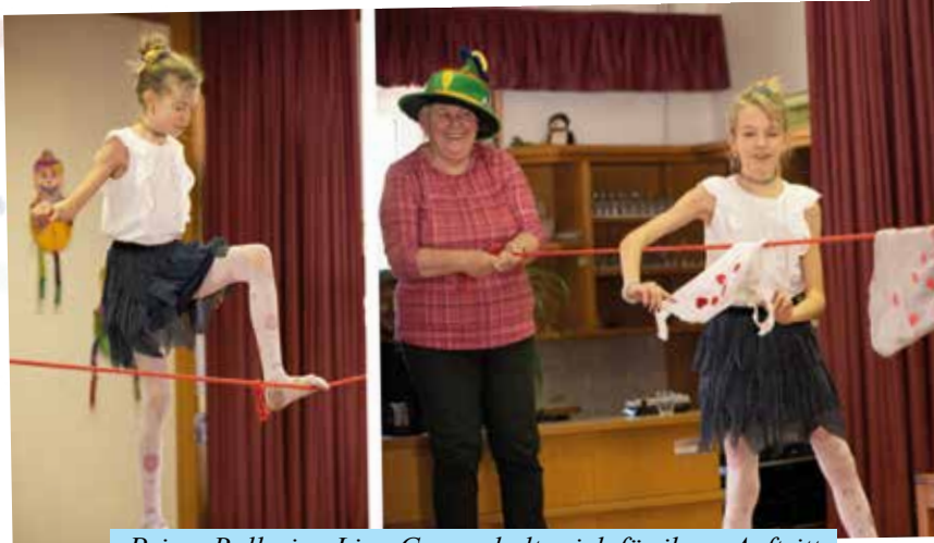
Prima Ballerina Lina Gasser holte sich für ihren Auftritt Unterstützung aus dem Publikum