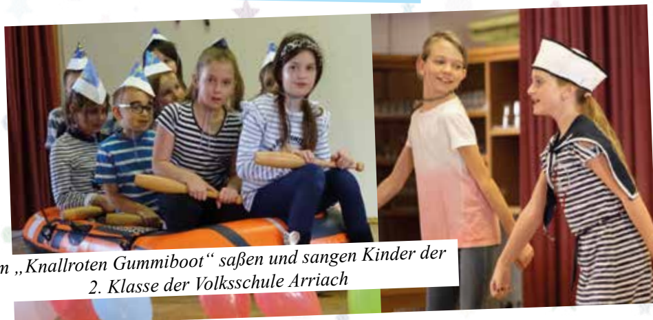
Im „Knallroten Gummiboot“ saßen und sangen Kinder der 2. Klasse der Volksschule Arriach