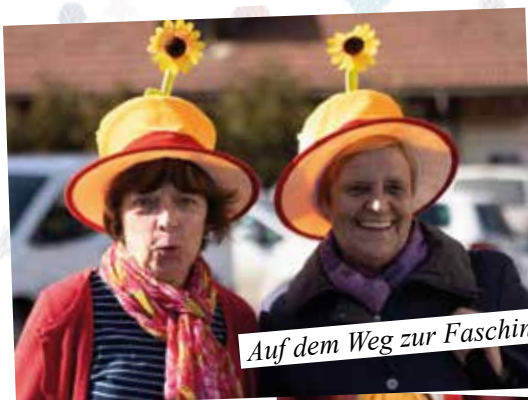
Auf dem Weg zur Faschingsitzung