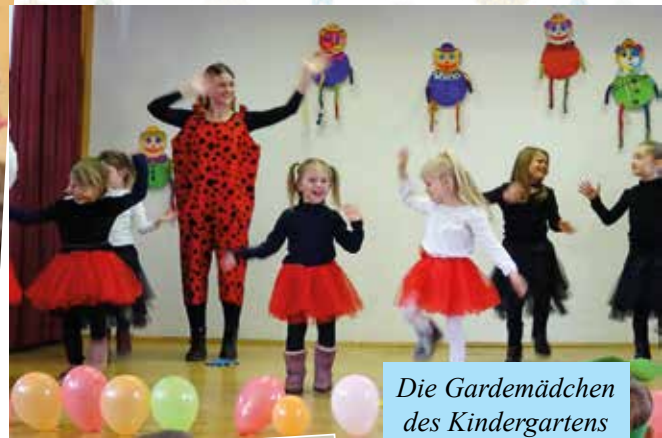
Die Gardemädchen des Kindergartens Arriach eröffneten schwungvoll mit dem Radetzky Marsch. Auch der mitreißenden Gummibärenanz animierte das Publikum zum Mitklatschen und versetzte gleich alle in ausgelassene Stimmung.