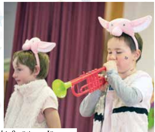
Das Trompetenschwein rettete die Hasen vor den schießwütigen Jägern.