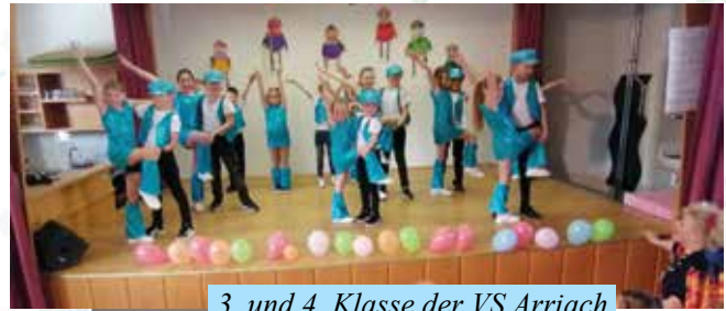
3. und 4. Klasse der VS Arriach