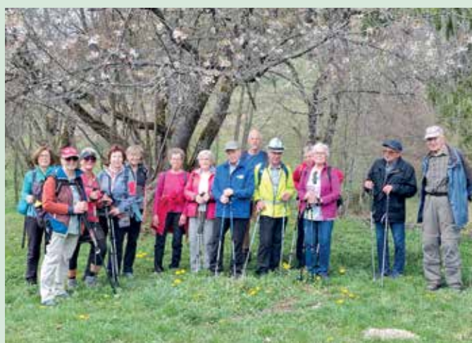
Wanderung am Panoramaweg

Unsere aktuellen Termine und die genaue Info bekommt man auch über WhatsApp. Wer noch nicht dabei ist, kann sich einfach unter 0677/61400200 melden.