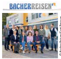
Das Bacher-Reise-Team 2026

Mit vielen guten Gefühlen wurden die Reisen vom Bacher-Team geplant. Mehr unter www.bacher-reisen.at oder Tel. 04246/3072