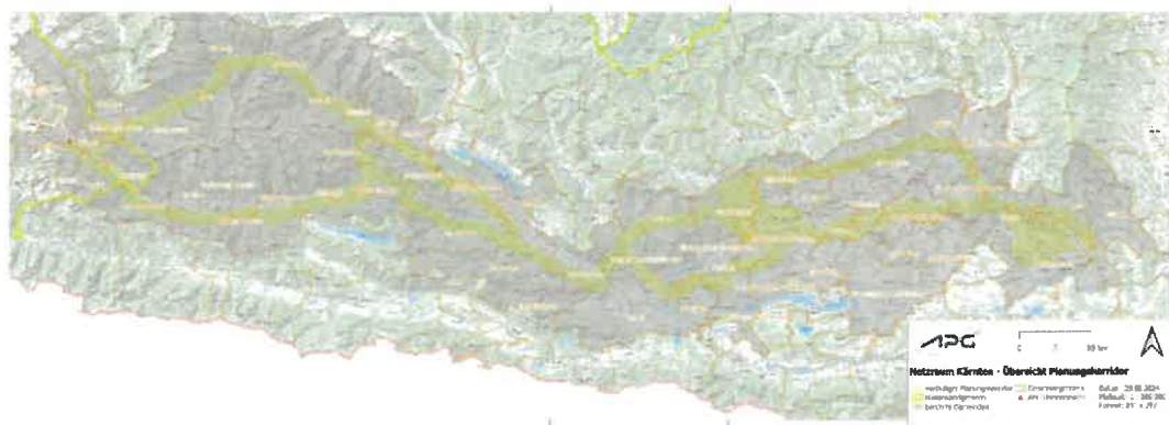
Abbildung 2-1: Projektgebiet des Vorhabens für den Korridor- und Trassenfindungsprozess

Auf Basis bestehender Grundlagedaten (Siedlungsstruktur, Geländedaten, Infrastruktur, etc.) wurde eine Raumwiderstandsanalyse durchgeführt und in weiterer Folge ein Projektgebiet für mögliche Trassenkorridore ausgearbeitet. Das in Aussicht genommene Projektgebiet der projektierten 380-kV-Leitungsanlage ist dem beigelegten Übersichtsplan zu entnehmen (vgl. Abbildung 2-1 sowie Anhang)