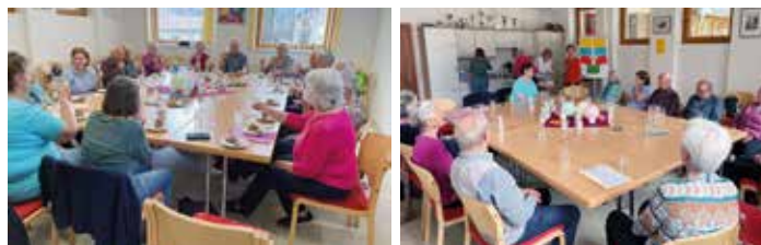
Teilnehmer von „Mitten im Leben“ beim gemütlichen Beisammensein