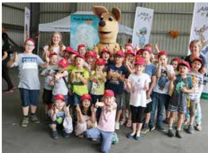
Text und Fotos: Seppele GmbH

Bereits zum dritten Mal wurden in Kärnten die von der Altstoff Recycling Austria AG (ARA) initiierten ARA4kids Recyclingtage in Kooperation mit dem Entsorgungsunternehmen Peter Seppele Gesellschaft m.b.H. veranstaltet. Auch die Kinder der Nachmittagsbetreuung des Kindergartens und der ersten Klasse der Volksschule Arriach kamen am 12. und 13. Juni nach Feistritz an der Drau, um sich spielerisch mit den Themen Abfallvermeidung, getrennte Sammlung und Verwertung von Verpackungen auseinanderzusetzen. Sie konnten unter anderem selbst Papier schöpfen, Abfälle aus einem „Seerosenteich“ fischen oder am Sortierband ihr Know-how testen. Belohnt wurden sie mit kleinen Geschenken und Medaillen.